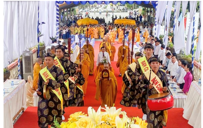
Cung nghinh chư tăng tại Đại lễ Vu lan báo hiếu 2023