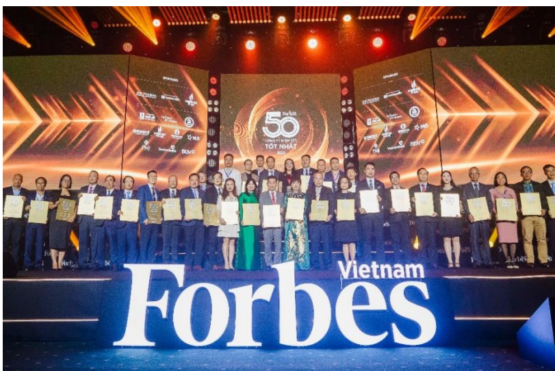
Lần thứ tư liên tiếp BIWASE được Forbes vinh danh Top “50 doanh nghiệp niêm yết tốt nhất Việt Nam”.