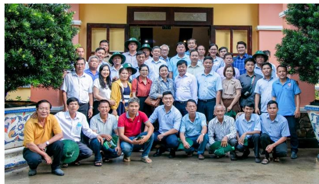
Đoàn công tác Hội Nông dân tỉnh Tây Ninh chụp ảnh lưu niệm tại Chi nhánh Xử lý Chất thải