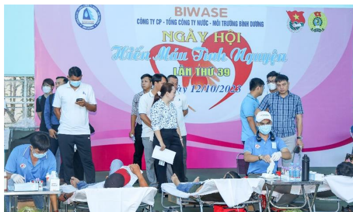
Ngày Hội Hiến máu tình nguyện lần thứ 39, lãnh đạo, đoàn viên thanh niên và người lao động BIWASE đóng góp 199 đơn vị máu

• Ngày 12/10 Chi đoàn cơ sở Tổng công ty BIWASE phối hợp Trung tâm Huyết học Bệnh viện Chợ Rẫy, Hội chữ thập đỏ tỉnh Bình Dương tổ chức Ngày Hội Hiến máu tình nguyện lần thứ 39. Chỉ trong buổi sáng, lãnh đạo, đoàn viên thanh niên, người lao động BIWASE đã hiến tặng 199 đơn vị máu. Trong đó có nhiều người đã trên 10 lần hiến máu, được tặng quà có giá trị kèm theo huy hiệu. Nhưng phần lớn những người tình nguyện đều chỉ nhận huy hiệu và “Xin gửi lại quà tặng cho những người khó khăn”. Chi đoàn còn thành lập “Ngân hàng máu sống” tập hợp anh em nhóm máu hiếm sẵn sàng hiến máu khi có yêu cầu. Đã có nhiều trường hợp đêm khuya hoặc đang trên đường đi làm mà bệnh viện tỉnh, Trung tâm truyền máu có người nguy kịch thuộc nhóm máu hiếm cần truyền máu khẩn cấp, anh em đều sẵn sàng lên đường giúp ngay.