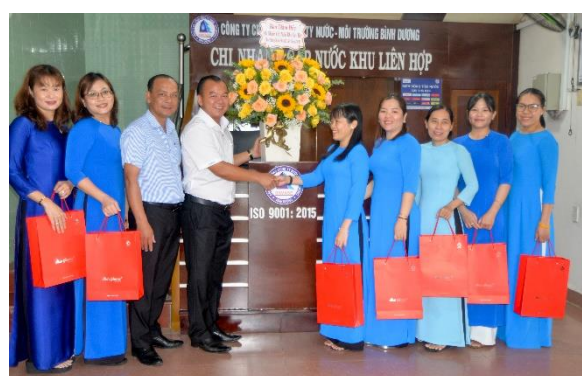
Lãnh đạo CN Cấp nước Khu Liên Hợp tặng quà chúc mừng lao động nữ nhân ngày Phụ nữ Việt Nam 20/10