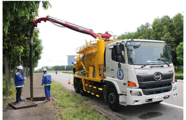
Công nhân môi trường BIWASE xử lý tắc nghẽn nước thải bằng phương tiện chuyên dụng hiện đại

• Các tập đoàn, nhà thầu cấp thoát nước môi trường nổi tiếng thế giới tìm kiếm cơ hội hợp tác với BIWASE. Cụ thể như Tập đoàn Xylem – Mỹ với thế mạnh về thiết bị, công nghệ, Tập đoàn SanLi – Singapore là nhà thầu thi công công trình cấp thoát nước, môi trường đã chọn Công ty cổ phần Xây lắp & Điện BIWASE (BIWELCO thành viên của BIWASE) làm đối tác hợp tác phát triển