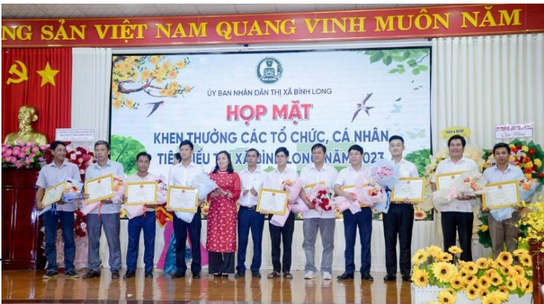
UBND Thị xã Bình Long khen thưởng các tổ chức cá nhân tiêu biểu đóng góp vào phát triển kinh tế - xã hội của địa phương

• UBND thị xã Bình Long tỉnh Bình Phước vừa tổ chức họp mặt mừng Đảng – mừng Xuân Bính Thìn 2024, kết hợp khen thưởng các tổ chức, cá nhân có thành tích xuất sắc, tiêu biểu năm 2023. Chi nhánh cấp nước BIWASE Chơn Thành được tặng giấy khen với thành tích đóng góp tích cực trong phát triển kinh tế - xã hội tại địa phương.