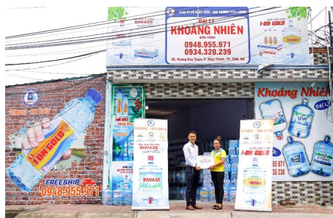
Đại diện BIWASE Ion Gold trao thưởng cho đại lý bán hàng xuất sắc

• BIWASE Ion Gold thưởng lớn cho các đại lý: Tích cực mở rộng thị trường, phát triển trên 1.000 cửa hàng và đại lý trải dài từ các tỉnh Đông và Tây Nam Bộ, Chi nhánh Dịch vụ Đô thị BIWASE với mặt hàng chủ lực là nước uống đóng chia BIWASE và BIWASE Ion Gold đạt doanh thu 117 tỷ đồng. Có 70 đại lý dẫn đầu về doanh số, được chi nhánh thưởng lớn vào dịp tổng kết cuối năm diễn ra vào ngày 1/2/2024.