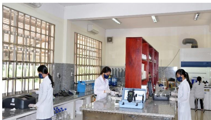
Kiểm soát chất lượng nước hàng ngày tại Phòng thí nghiệm BIWASE