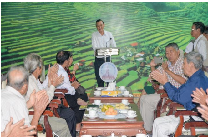
Họp mặt công tác viên bản tin Linh Hoa Tuệ Đoàn – CPHACO tại Hoa viên Chánh Phú Hòa

• Lãnh đạo các cấp thăm, chúc tết Tổng công ty BIWASE và các đơn vị thành viên: Nhân dịp Tết cổ truyền dân tộc, thể hiện mối quan hệ tốt đẹp, gắn bó giữa doanh nghiệp với địa phương, nhưng ngày giáp tết Tổng công ty BIWASE đã vinh dự đón tiếp các đoàn công tác Thành ủy - UBND thành phố Thuận An, Tân Uyên, Thị xã Bến Cát đến thăm, chúc tết.