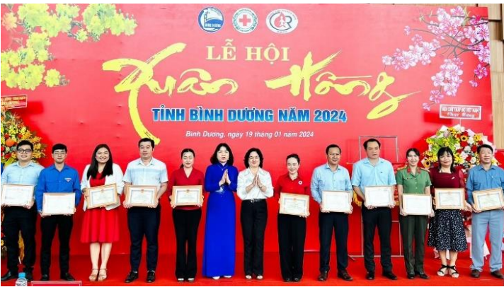
UBND tỉnh Bình Dương vinh danh các tổ chức, cá nhân xuất sắc trong tuyên truyền vận động hiến máu tình nguyện năm 2024

động trẻ mỗi năm BIWASE tổ chức 2 đợt hiến máu tình nguyện. Mỗi đợt có trên 200 tình nguyện viên tham gia.