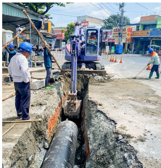
Sau khi M&A BIWASE đầu tư mạnh vào phát triển đường ống, khách hàng, chống thất thoát, từ đó sinh lãi trước kế hoạch