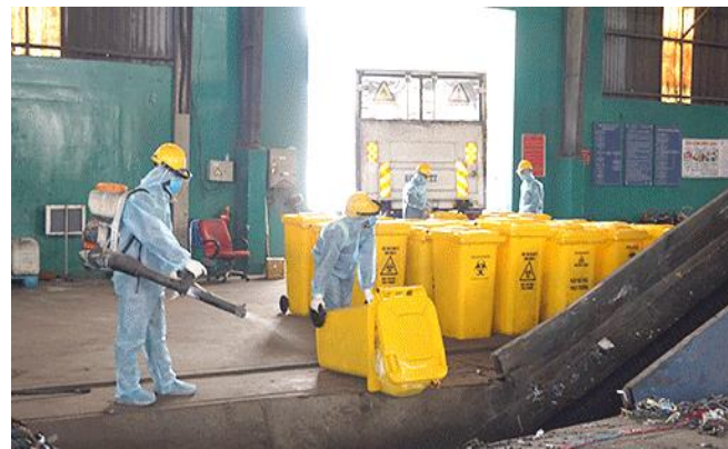
Chi nhánh xử lý chất thải của BIWASE đang đảm bảo gom an toàn tại các khu cách ly, điều trị Covid-19

Được giao nhiệm vụ thu gom, xử lý chất thải, rác thải trên địa bàn tỉnh bảo đảm vệ sinh môi trường, Chi nhánh Xử lý chất thải Biwase đã chủ động xây dựng và thực hiện quy trình “Thu gom xử lý chất thải không tiếp xúc”. Trước tiên là bảo đảm sức khỏe, sự an toàn của người lao động, hoạt động an toàn, liên tục của chi nhánh và làm tốt nhiệm vụ được giao. Từ đợt bùng phát dịch lần thứ 4 đến nay, lãnh đạo chi nhánh cùng trên 900 cán bộ công nhân viên đã tự nguyện ở lại nhà máy làm việc theo nhóm với quy trình “không tiếp xúc”, khử khuẩn 3 lần/ngày, kết hợp xét nghiệm sàng lọc Covid-19, bảo đảm chế độ ăn uống, nghỉ ngơi sinh hoạt tại chỗ. Nhờ vậy cho đến nay toàn bộ cán bộ công nhân viên đều được