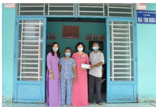
BIWASE trao tặng quà cho gia đình chính sách, hỗ trợ khó khăn mùa dịch

Chủ động chia sẻ khó khăn với người dân, khách hàng, góp phần bảo đảm an sinh xã hội do ảnh hưởng dịch Covid-19, Công ty cổ phần Nước Môi trường Bình Dương đã chủ động gửi văn bản đến lãnh đạo UBND tỉnh cho phép công ty được giảm giá nước sạch phục vụ sinh hoạt với mức giảm 10% áp dụng cho hộ gia đình và 31,8% áp dụng cho cơ quan hành chính sự nghiệp, trường học, bệnh viện. Qua điều chỉnh giảm giá, mức giá được áp dụng cho cả 2 loại hình là 9.000 đồng/m 3 . Thời gian áp dụng là 2 tháng cho kỳ hóa đơn tiền nước của tháng 8 và tháng 9/2021. UBND tỉnh đã chấp thuận đề nghị của Biwase. Tổng số tiền nước công ty sẽ giảm cho khách hàng đợt này ước khoảng 20 tỷ đồng. Từ trước đến nay Công ty Biwase luôn áp dụng chính sách: Miễn phí tiền nước cho gia đình Mẹ