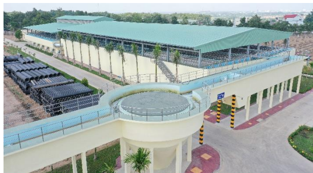
NMN Dĩ An 2 – Công suất cho 2 đơn nguyên, mỗi đơn nguyên 100.000m 3 /ngày đêm

Ông Trần Chiến Công, Tổng giám đốc Công ty cổ phần Nước Môi trường Bình Dương vừa ký văn bản công bố công suất các nhà máy nước trực thuộc Biwase (9 chi nhánh) sau khi hoàn thiện hệ thống, vận hành ổn định đã đạt công suất 760.000m 3 /ngày đêm. Công suất xử lý tăng cường đạt 1 triệu m 3 /ngày đêm. Công suất nước đủ đáp ứng trong vài năm tới và để phát huy tối đa công suất của các công trình đã được hoàn thành, đưa vào sử dụng. Sắp tới Biwase tập trung đầu tư mở rộng mạng lưới, phát triển đầu nối khách hàng, đáp ứng nhu cầu nước sạch phục vụ sinh hoạt và sản xuất ngày càng tăng tại địa phương.