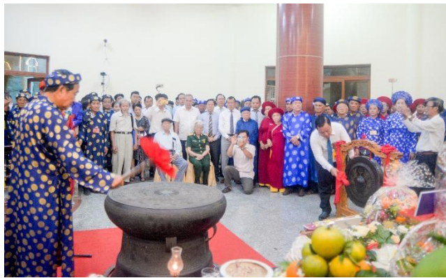
Lãnh đạo Hoa viên nghĩa trang Bình Dương thực hiện nghi thức khai lễ Giỗ Tổ Hùng Vương 2024