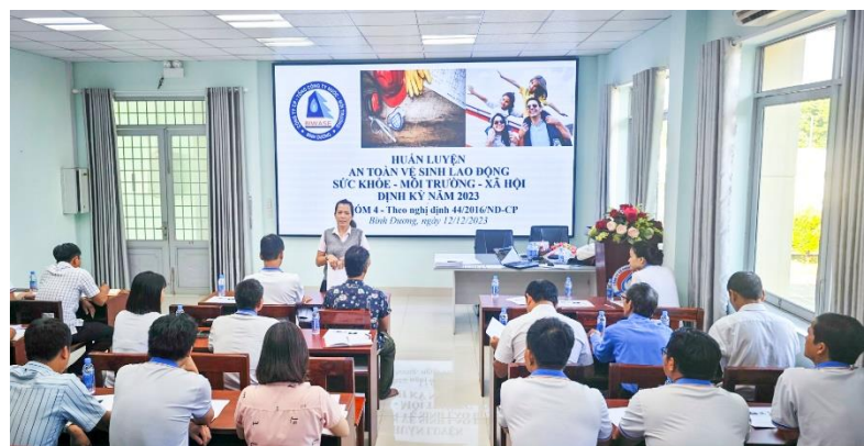
Tập huấn An toàn vệ sinh lao động tại GIWACO

• 100% CBCNV GIWACO được đào tạo an toàn lao động: Tuân thủ pháp luật, bảo đảm an toàn vệ sinh lao động vừa là mục tiêu vừa là văn hoá của doanh nghiệp, hướng đến chuyên nghiệp hoá trong mọi hoạt động sản xuất kinh doanh, Công ty cổ phần Cấp nước Gia Tân (huyện Thống Nhất, tỉnh Đồng Nai) luôn chú trọng công tác đào tạo, nâng cao chất lượng nguồn nhân lực thông qua việc tổ chức các lớp tập huấn, bồi dưỡng nghiệp vụ và an toàn lao động cho CBCNV, người lao động trong công ty. Sau 2 năm kiện toàn bộ máy, đến nay 100% CBCNV, người lao động trong công ty đã qua đào tạo nghiệp vụ, được cấp chứng nhận hành nghề theo quy định. Nhờ có đội ngũ lao động lành nghề, các hoạt động sản xuất kinh doanh trong công ty bảo đảm an toàn, đúng kế hoạch.