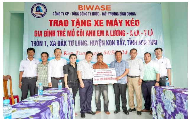
Đại diện Công ty BIWASE, chính quyền địa phương và báo Sài Gòn Giải Phóng tặng tiền mua máy kéo cho gia đình A Lương

Đã thành truyền thống, đến mùng 10 tháng 3 âm lịch Công ty cổ phần đầu tư xây dựng Chánh Phú Hoà tổ chức lễ Giỗ tổ Hùng Vương tại công trình kiến trúc tâm linh Cây Đa Hòn Việt với đầy đủ các nghi thức rước lễ; đại diện các đình làng dâng cúng hoa quả; kỳ văn như bảng báo cáo tóm lược trình lên các bậc tiền nhân, quốc tổ về tinh thần đoàn kết vượt qua khó khăn, xây dựng và phát triển kinh tế tỉnh nhà. Công trình kiến trúc Cây Đa Hòn Việt và lễ Giỗ tổ Hùng Vương hàng năm là dịp để người dân Bình Dương và du khách thập phương đến chiêm bái, tưởng niệm các Vua Hùng khi chưa có dịp về thăm đất tổ Phú Thọ.