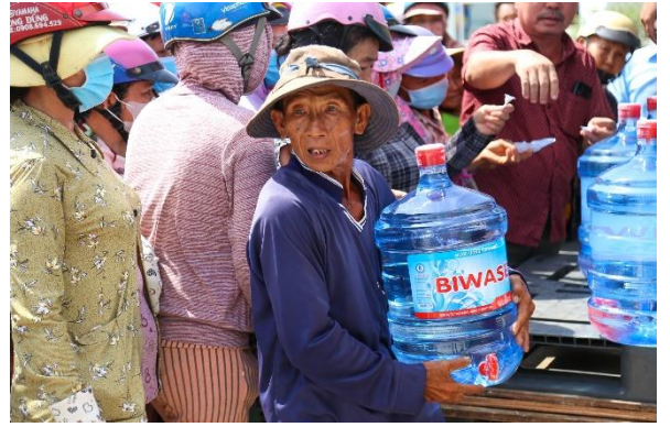
Người dân vùng hạn mặn tỉnh Bến Tre nhận quà cứu trợ từ BIWASE

• Biwase hỗ trợ tỉnh Bến Tre khắc phục hạn mặn: Kịp thời chia sẻ khó khăn với bà con tỉnh Bến Tre đang thiếu nước sinh hoạt do chịu ảnh hưởng hạn hán kéo dài và xâm nhập mặn diễn ra gay gắt. Lãnh đạo Công ty CP – Tổng công ty Nước - Môi trường Bình Dương đã cử nhiều đoàn công tác đến Bến Tre trao tặng 800 bình nước đóng chai loại 20 lít, hỗ trợ 14 bồn trữ nước (500 lít) và 2 sà lan chở 1.800m 3 nước sạch về phân phát cho bà con sử dụng. Đầu tháng 5 đã xuất hiện mưa đầu mùa, hạn mặn có chiều hướng giảm nhưng Tổng công ty BIWASE tiếp tục cử đoàn công tác mang theo 1.000 bình nước (loại 20 lít), 100 thùng nước uống đóng chai BIWASE và 20 triệu đồng hỗ trợ 10 gia đình khó khăn huyện Ba Tri tỉnh Bến Tre.