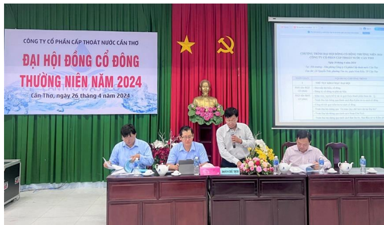
Đại hội đồng cổ đông thường niên năm 2024 Công ty Cổ phần Cấp thoát nước Cần Thơ (CanThoWassco)

I tăng 4,64% so cùng kỳ. Việc bảo đảm cấp nước an toàn, liên tục trước các diễn biến bất lợi của thời tiết đã góp phần mang lại sự an tâm cho người tiêu dùng, đồng thời góp phần quan trọng vào năng lực thu hút đầu tư, tăng trưởng kinh tế - xã hội của tỉnh nhà.