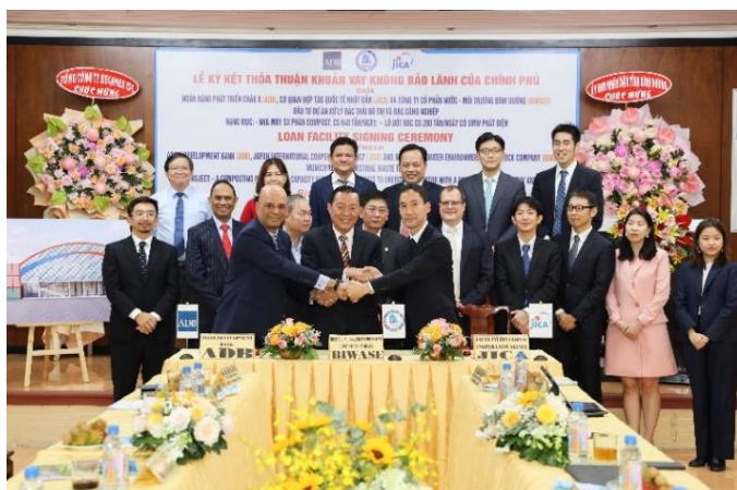
Lễ ký kết thoả thuận tài trợ vốn không qua bảo lãnh của chính phủ giữa ADB, JICA với Biwase

Ngày 9-12, đã diễn ra lễ ký kết thoả thuận khoản vay không qua bảo lãnh của chính phủ giữa Ngân hàng phát triển Châu Á (ADB) và Cơ quan hợp tác Quốc tế Nhật Bản (JICA) với Công ty Cổ phần Nước - Môi trường Bình Dương. Theo đó, Biwase được vay vốn ưu đãi 20 triệu USD để phục vụ dự án Nhà máy sản xuất phân Compost công suất 840 tấn/ngày, lò đốt rác công suất 200 tấn/ngày có phát điện công suất 5MW/giờ.