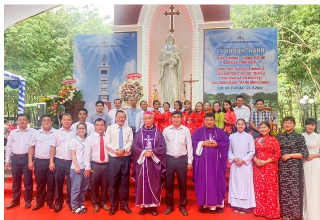
Lễ khánh thành tháp chuông, tượng Đức mẹ Maria và Chúa Jesus tại Hoa viên nghĩa trang Bình Dương (năm 2022)

Cùng với khu mộ dành cho Cha – Mẹ Việt Nam Anh Hùng, Hoa viên Bình Dương còn có các quần thể kiến trúc – tâm linh như Linh Hoa Tuệ Đàn, Chùa Một Cột, chùa Thiên Phước...Mới đây Hoa Viên đã khánh thành tháp chuông và tượng Đức Mẹ Maria toạ lạc ngay trung tâm khu mộ dành cho tín hữu công giáo.